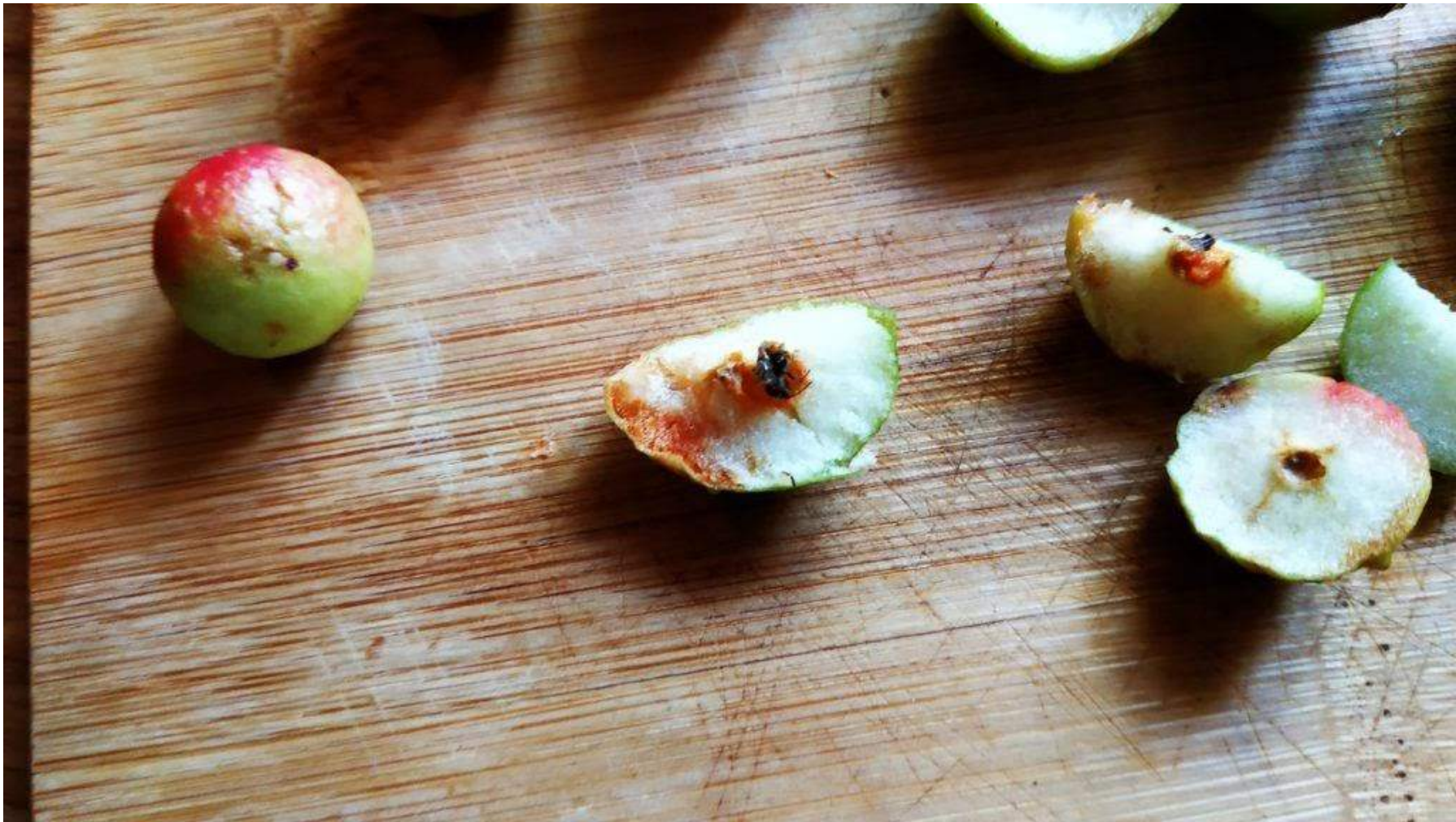
Zde je vidět již téměř dospělá žlabatka